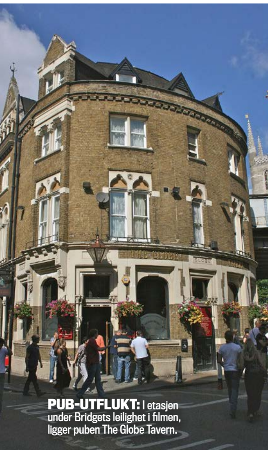
PUB-UTFLUKT: I etasjen under Bridgets leilighet i filmen, ligger puben The Globe Tavern.

London, og rollefiguren er kjent for sin britiske humor, selvironi og sjarmerende klønethet.