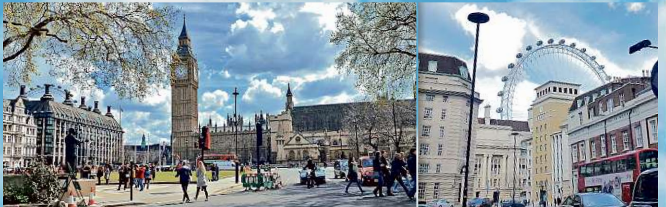
■ Small Car Big City confecciona paseos a la medida. Una buena elección es combinar la visita a sitios famosos con paradas en pequeñas joyas poco frecuentadas por turistas.

DOMINGO 12 / 06 / 2016 5628 7294 de viaje @reformadeviaje deviaje@reforma.com Editora: Laura Pardo