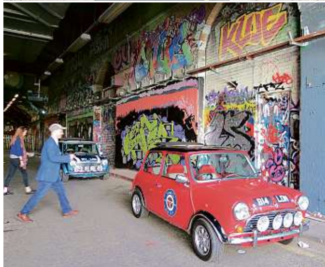
■ Los Mini Cooper siempre han tenido un lugar especial en el corazón de los británicos. Aquí, Rosie (Rover Mini Cooper, 1994), en rojo tartán, y Lulu (Mini Cooper Sports Pack, 1998), en azul turquesa.