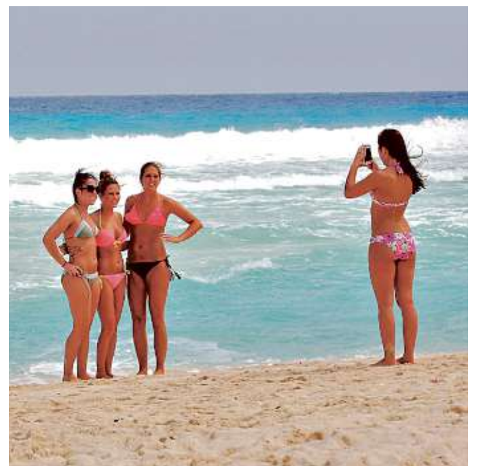
■ Las playas aún están de moda, pero si el itinerario contempla alguna actividad ecoturística, qué mejor.

Para los viajes de graduación, lo de hoy son las experiencias con sabor local, de aprendizaje cultural y ecoaventura. Lo auténtico va ganando terreno, de acuerdo con los expertos. ANALINE CEDILLO