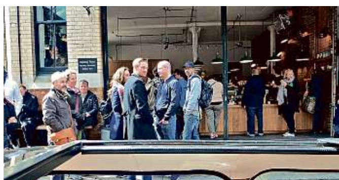
■ No se puede ser indiferente a los descapotables, como lo demuestran estos comensales del Borough Market, paraíso gourmet.